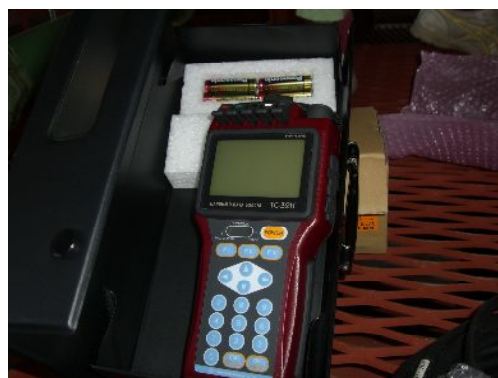
データログ(データ蓄積)