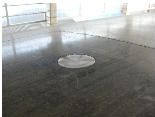
圧力センサー(型枠表面)

効果 コンクリート打設圧力の設定が行えるため、充填かつ密実なコンクリートが打設出来る。